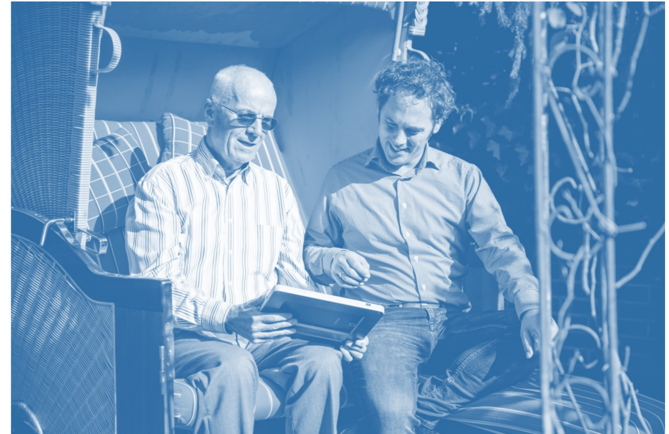
Afbeelding 8: Hulp voor inwoners bij een aanvraag