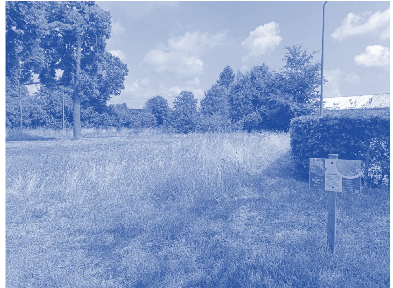
Afbeelding 5: Eén van de 40 locaties 'bloemrijk gras'

Staat (deels) opgenomen in bestaand beleid.