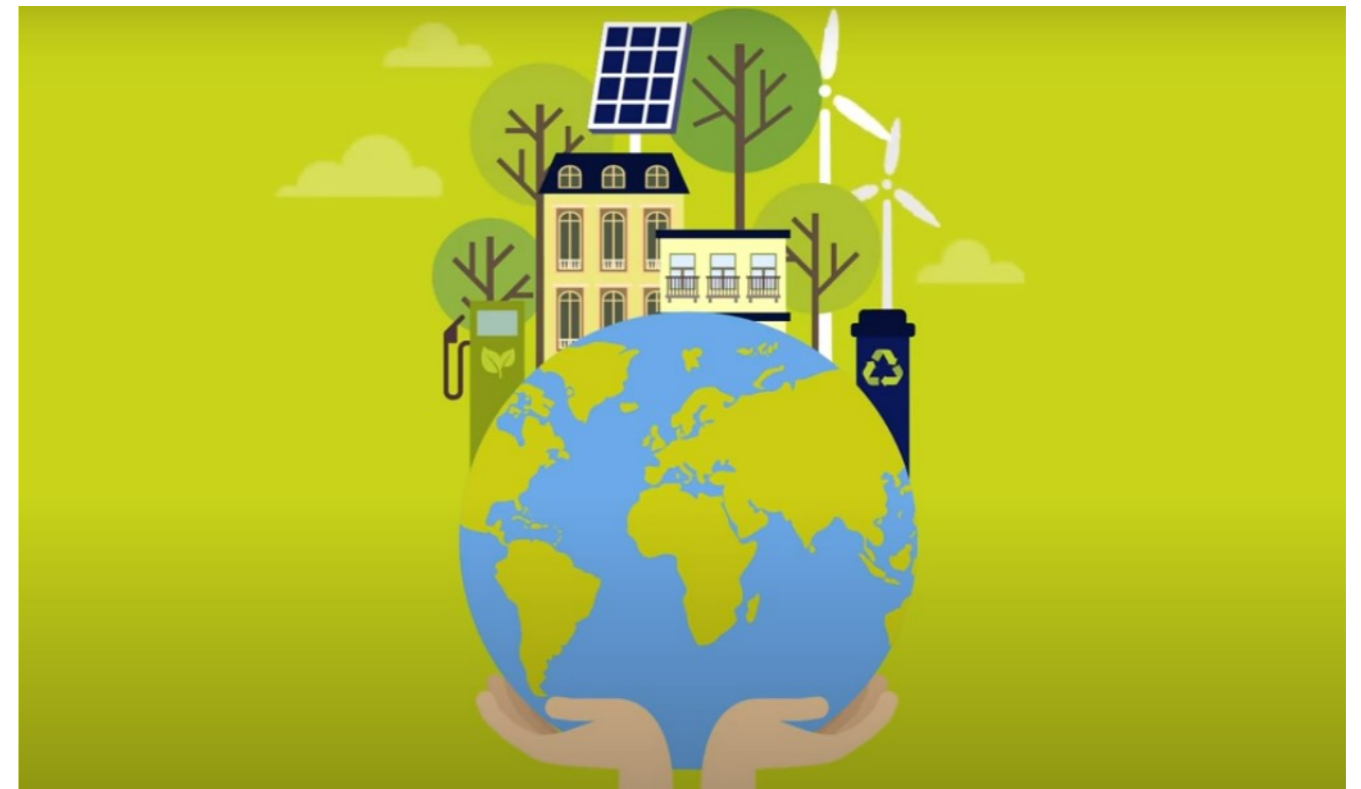
Afbeelding 3: Rhedense animatiefilm over de klimaatopgave (klik op de afbeelding)

vergemakkelijken. Dit kunnen we bijvoorbeeld bereiken via projecten op gebied van leefbaarheid en biodiversiteit, waar mensen samenwerken om hun eigen leefomgeving te vergroenen. Het mooie resultaat is direct zichtbaar, anders dan met de energietransitie die toch vrij technisch en abstract is. Via de verbindingen die zo tussen inwoners onderling ontstaan, kunnen inwoners vervolgens ook makkelijker samenwerken in bijvoorbeeld het samen kopen van een buurtbatterij, elkaar helpen met klussen of het regelen van zonnepanelen op alle huizen in hun eigen straat.