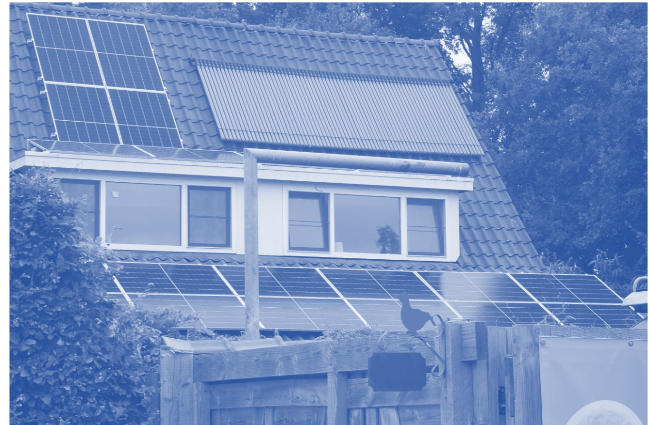
Afbeelding 7: Voorbeeld verduurzaming woning

Of het gaat lukken om in 2040, danwel 2050 CO 2 -neutraal te zijn als gemeente Rheden is nog niet zeker. Daarvoor zijn we ook in grote mate afhankelijk van andere, veelal landelijke ontwikkelingen. De voortschrijdende techniek gaat ons helpen, maar ook wet- en regelgeving zal (kunnen) bijdragen aan het sneller kunnen behalen van het doel om CO 2 -neutraal te worden. In de tussentijd stimuleert en faciliteert de gemeente Rheden waar mogelijk activiteiten en werkzaamheden die bijdragen aan de CO 2 -neutraliteit.