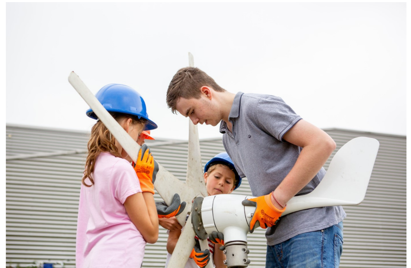
Afbeelding 9: Educatie over duurzaamheid