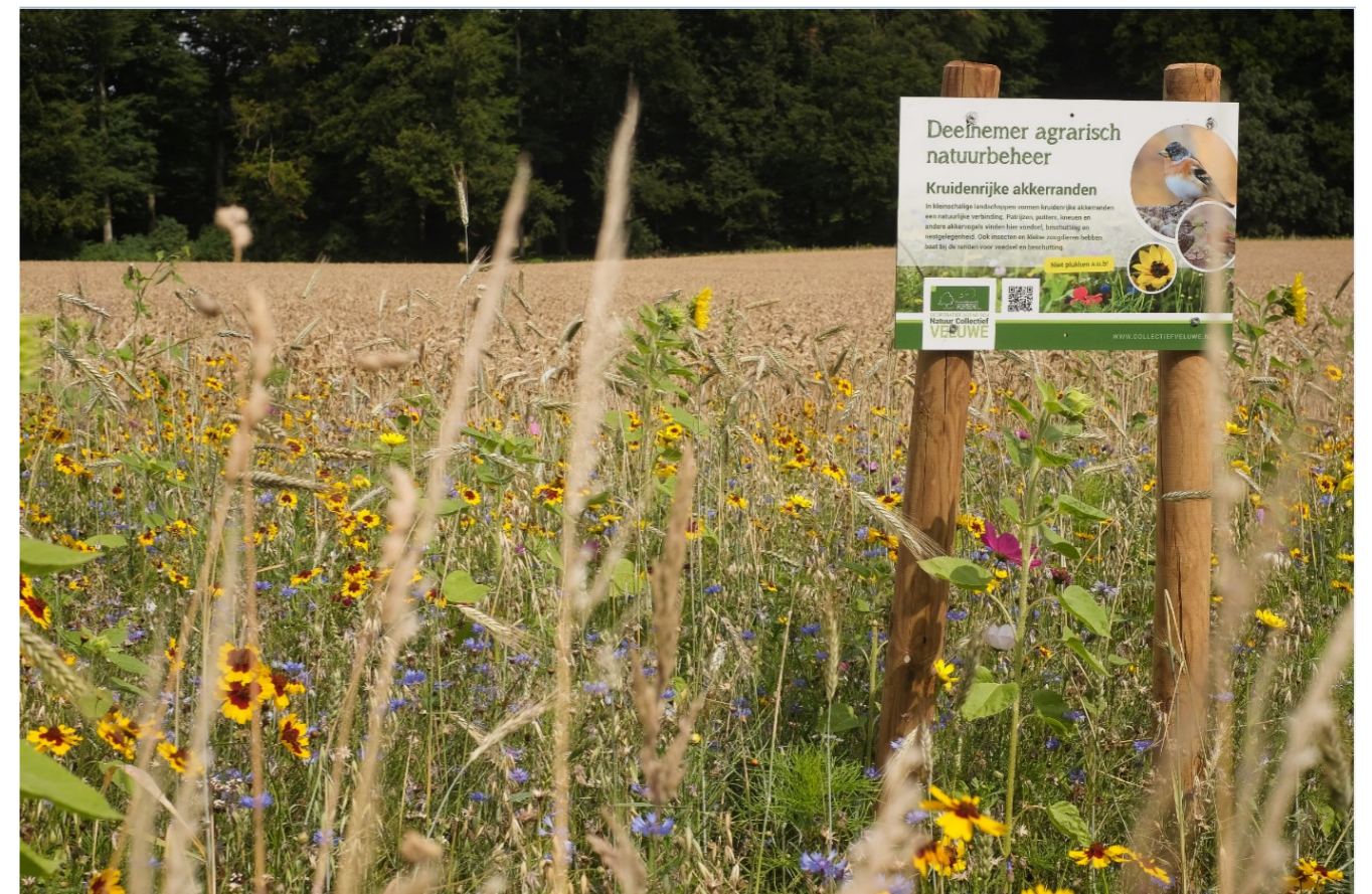
Afbeelding 6: agrarisch natuurbeheer in de gemeente Rheden