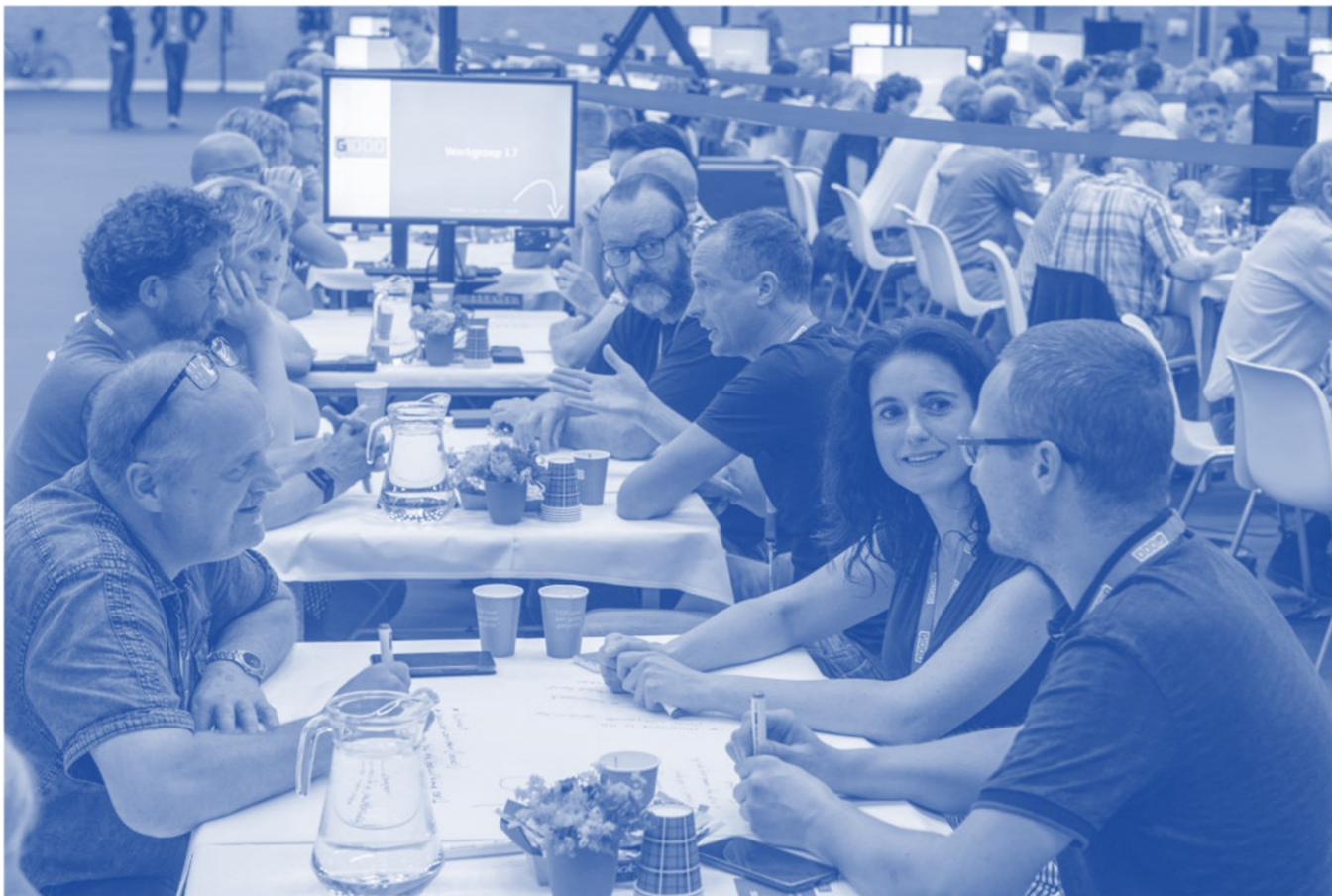
Afbeelding 1: Impressie G1000Burgerberaad Rheden

Voor u ligt de Duurzaamheidsagenda 2023-2026 met de titel 'Samen in Transitie naar een CO 2 -neutraal Rheden in 2040' . De agenda is in samenspraak met de klankbordgroep en de werkgroepen van het burgerberaad tot stand gekomen.