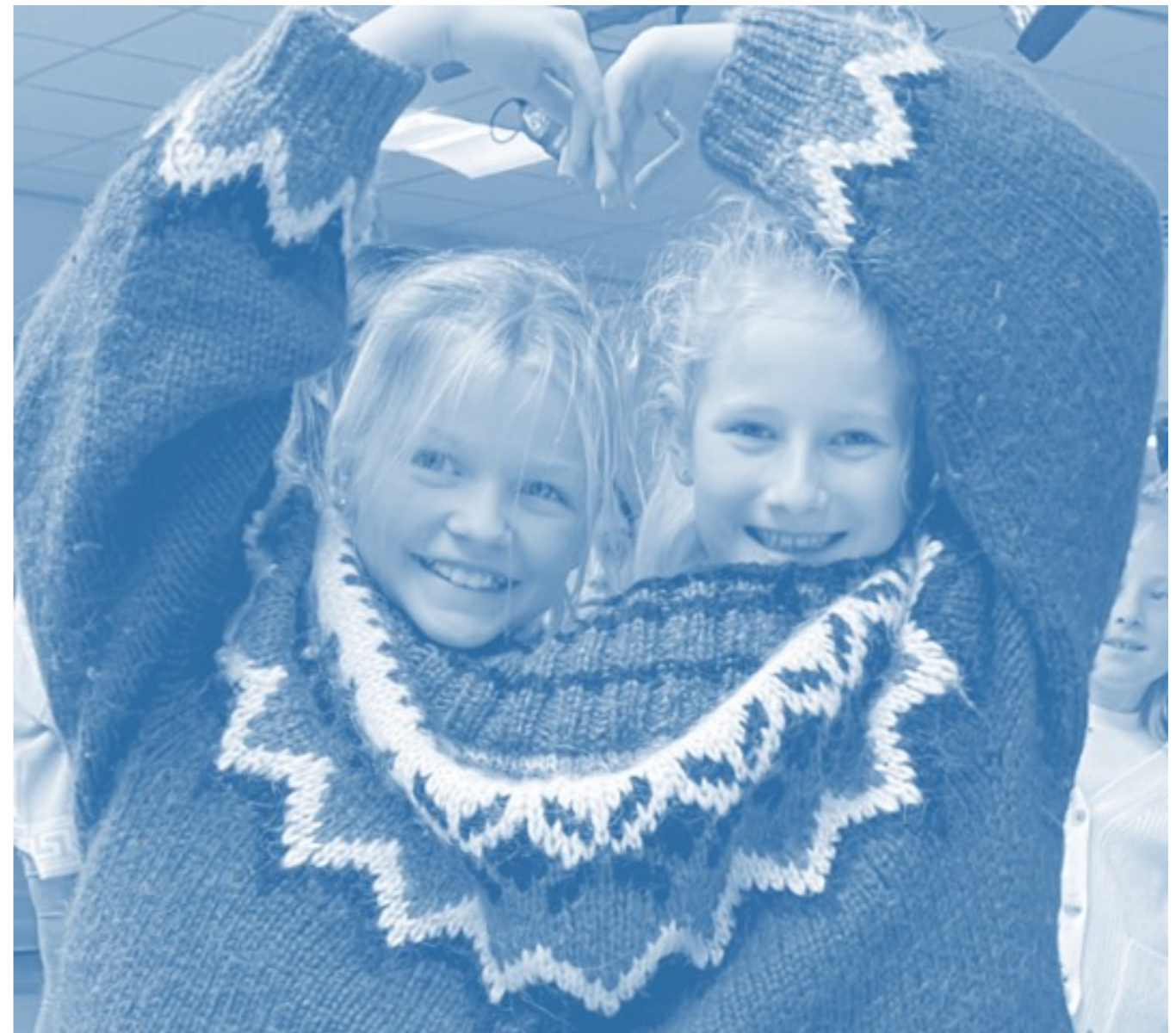
Afbeelding 4: voorlichting op scholen (de Klimaatweek)

We verkennen de mogelijkheden om vanuit de gemeentelijke afvaltaak hierin stappen te zetten.